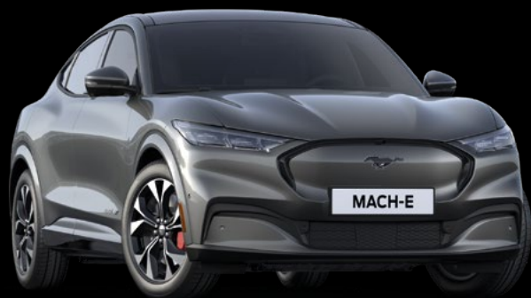
CARBONIZED GREY - LAKIER METALIZOWANY BEZ DOPLATY