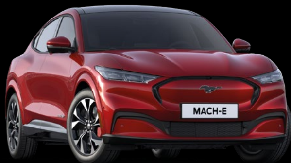
LUCID RED- LAKIER METALIZOWANY SPECJALNY BEZ DOPLATY